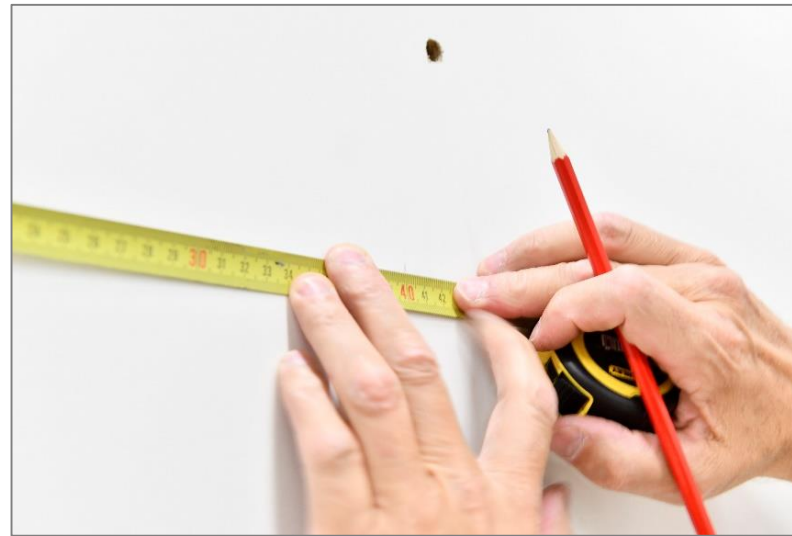
Traçage au mur.