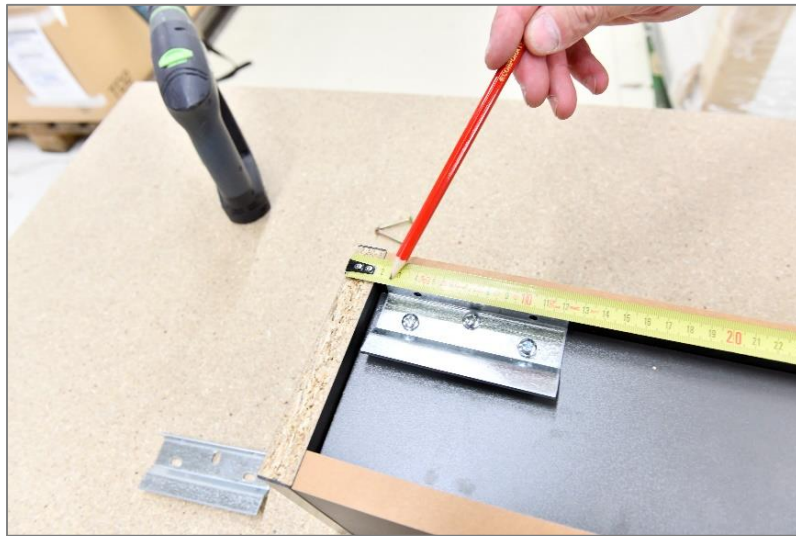
Repérage des cotes. (Voir schémas techniques à la fin du catalogue).